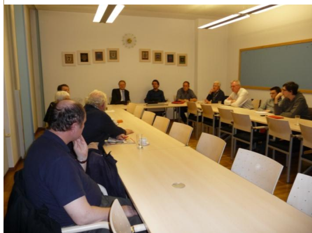
Abbildung 2 & 3: 4. Mobilitätsplattform